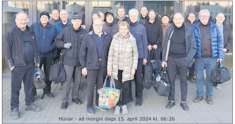
Húnarnir - að morgni dags 15. apríl 2024 kl. 06:26

Það er áhugaverður hópur „heldri“ bæjarbúa sem mætir fyrstur alla morgna í sundlaugina í Ásgarði.