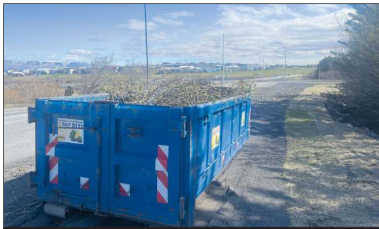
Garðbæingar hafa verið duglegir að koma garðaúrgangi fyrir í gámunum 33 sem eru á góðum stöðum í bæjarlandinu

Garðbæingar hafa aldeilis látið til sín taka í vorhreinsun lóða og hafa verið duglegir að koma garðaúrgangi fyrir í gámunum 33 sem eru á góðum stöðum í bæjarlandinu.