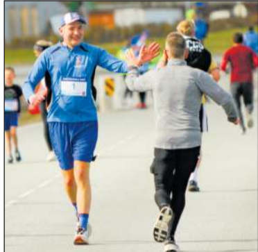
Guðni TH forseti tók nokkrar fimmur á leiðinni og hafði gaman af