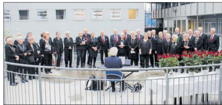
Kór eldri borgarar, Garðakórinn fékk úthlutað styrk að upphæð 500.000 kr.