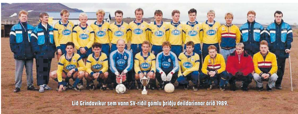
Lið Grindavíkur sem vann SV-riðil gömlu þriðju deildarinnar árið 1989.

Það er orðið meira um vopnaburð í dag og auðvitað er það áhyggjuefni, sérstaklega að sjá unglinga draga upp hnífa. Maður var skotinn um daginn, þetta er þróun sem er vissulega ekki góð en svona er bara veruleikinn orðinn og við honum þarf lögreglufólk að geta brugðist. Ég hef mikla trú á rafbyssunum, þjálfun er í gangi þessa dagana og ég bind miklar vonir við þetta tól. Ég sé ekki hvað mælir á móti þessu, það er ekki hægt að beita rafbyssunni nema skýrt komi í ljós hvernig viðkom-