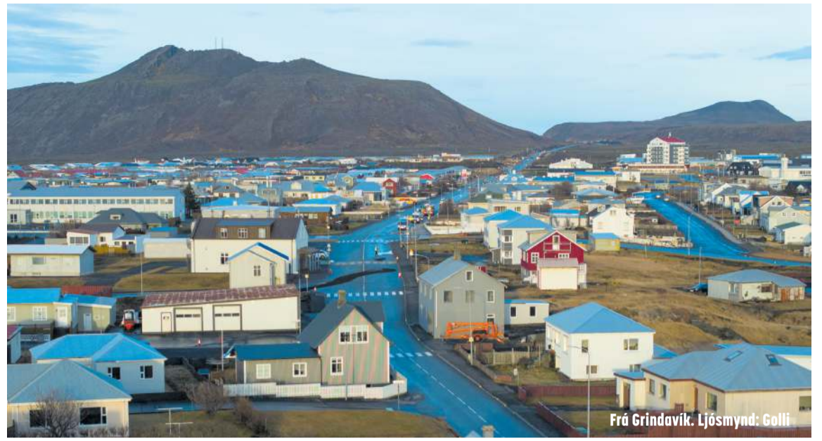
Frá Grindavík.

A íbúafundi í Reykjanesbæ á dögunum var upplýst um að ef