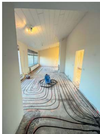
Hjónin eru búin að gera mikið fyrir nýja húsið sitt eins og sjá má.