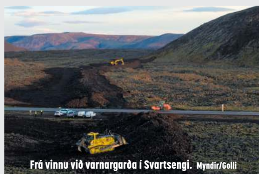
Frá vinnu við varnargarða í Svartsengi.