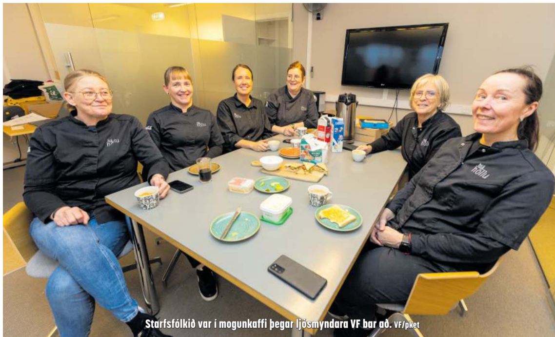
Starfsfólkið var í mogunkaffi þegar ljósmyndara VF bar að.

Þið kannist eflaust við tilfinninguna við að koma heim í kotíð ykkar eftir langt sumarfrí erlendis. Það myndu fáir leggja af stað ef þeir vissu að þeir ættu ekki afturkvæmt. Ég veit að ég hefði aldrei farið nema vera viss um það að ég kæmist aftur heim. Nú er hinsvegar stór hópur fólks sem á engra annarra kosta vól en að halda sig fjarri heimilum sínum, ýmist vegna náttúruhamfara eða stríðsátaka. Það er ekki öruggt að vera heima þó að heima sé best. Það sem áður myndaði eina samstæða heild hefur nú sundrast í allar áttir í leit að nýjum gríðarstöðum. Þar sem allt annað þarf að víkja fyrir aðlögunarfærni heilla fjölskyldna í óvissu. Minningasköpunin heldur ótraud áfram í takt við tímann, hvort sem hún er góð eða slæm. Flestir hugsa þó heim og myndu hvergi annarstaðar vilja vera en einmitt þar.