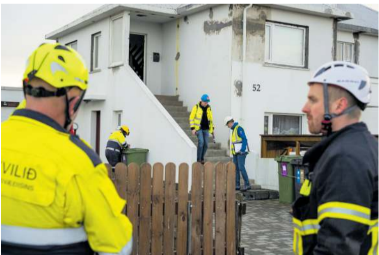
Ljósmyndarinn Kjartan Þorbjörnsson, Gollí, var í Grindavík og myndaði aðgerðir.

Um tuttugu eignir voru skoðaðar um liðna helgi en þá var ákveðið að láta staðar numið enda menn í miðjum atburði og sprungur enn að myndast og ljóst að meira tjón getur orðið.