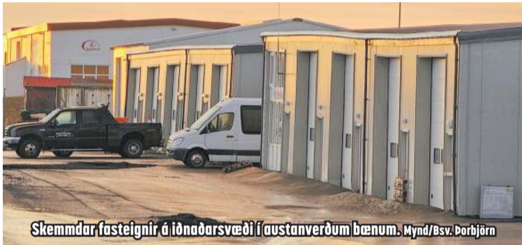
Skemmdar fasteignir á íbúðarsvæði í austanverðum bænum.