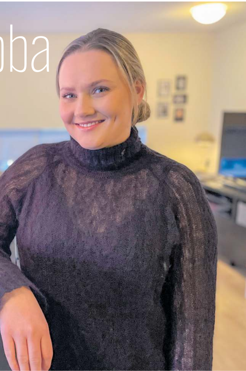
Í hendurnar á síðasta ári.

hagslegum stuðningi með lyfja- styrk í samvinnu við Apótekarann, Styrktarsjóð og Minningarsjóð fyrir aðstandendur ef að félagsmaður fellur frá vegna veikinda sinna.