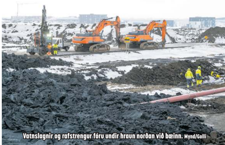
Vatnslagnir og rafstrengur fóru undir hraun norðan við bæinn.

Stofnstrengur rafmagns frá Svartsengi skemmdist í hraunrennslinu og var því bráðabirgðastrengur hengdur yfir hraunið. Á meðan var Grindavík keyrð á færanlegum varaafslvélum í eigu Landsnets til að halda rafmagnni á byggðinni. Dreifikerfið er því laskað en með mikilli aðstoð ýmissa aðila hefur tekist að fæða nær öll hús með rafmagni. Dreifikerfið er viðkvæmt gagnvart jarðhræringum, álagi og veðri. Viðgerðir verða umfangsmiklar og tímafrekar, segir jafnframt í samantekt Almannavarna á ástandi dreifikerfa. Þar kemur einnig fram að fjarskiptakerfi í Þorbirni eru keyrð á varaafstöðvum þar sem rafstrengur upp á fjallið er skemmdur.