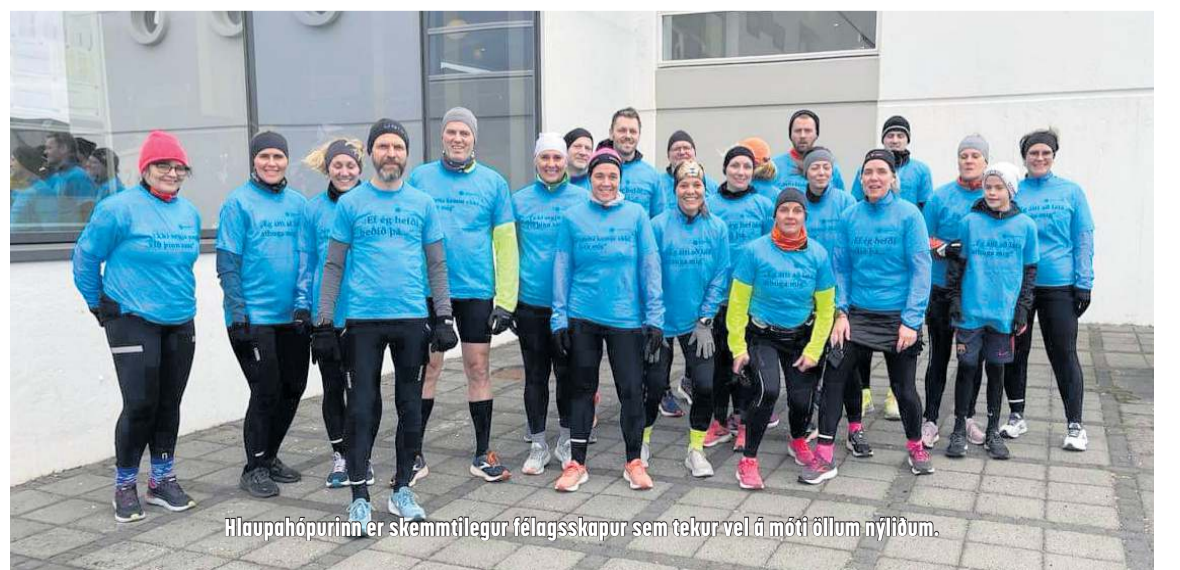
Hlaupahópurinn er skemmtilegur félagsskapur sem tekur vel á móti öllum nýliðum.