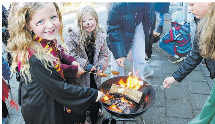
Grillað í félagsstarfi.

Í október vorum við með einn vinsælasta viðburð félagsmiðstöðvanna Hundrad&ellefu, Hólmasels og Bakkans en það er náttfatanóttin. Það var mikil stemning á öllum stöðum og boðið upp á fjölbreytta dagskrá sem dæmi má nefna pizzaveislu, bakstur, brjóstsykursgerð, íþróttahús um miðja nótt, kvikmyndamaráðun og margt fleira. Allt gekk vel um nóttina og allir fóru gláðir heim að sofa á laugardagsmorgninum. Einnig var félagsmiðstöðvargurinn haldinn hátíðlega í öllum fjórum félagsmiðstöðvunum, Bakknum, Hellinum, Hundrad-