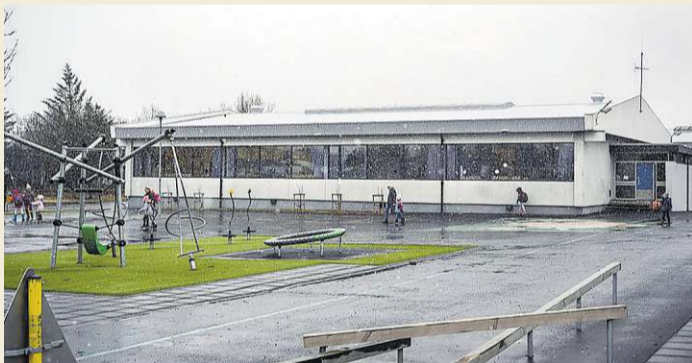
Fossvogsskóli er einn þeirra skóla sem hefur farið illa vegna mygluskemmda.