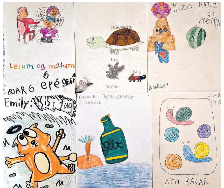
Nokkrar af myndum barnanna sem verða á sýningunni í Gerðubergi 9. des.

hverjum vetri. Og þá koma foreldrar með. Sá hluti verkefnisins er rétt að hefjast, en byrjað var á að hittast í Gerðubergi í hrekkjavökugrímugerð þann 28. október og næst var haldið í Hörpu þann 19. nóvember að heilsa upp á músina Maximus.