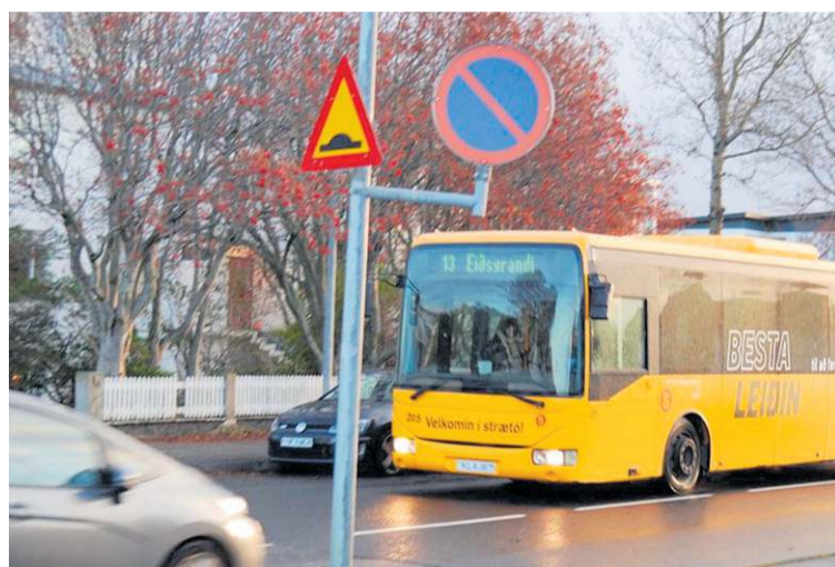
Strætó kynnir sig með áletruninni „Besta leiðin“ á strætisvögnunum. Með nýju leiðakerfi gæti þetta orðið að veruleika.

Samkvæmt greiningu strætó búa aðeins 19% íbúa höfuðborgarsvæðisins nálægt almenningsgangum þar sem tíðnin er 7 til 10 mínútur. Með nýju leiðakerfi er stefnt að því að 66% íbúa hafi greiðan aðgang að slíkum almenningsgangum.