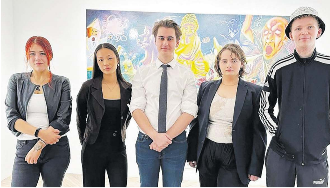
Útskriftarnemar á við opnun sýningarinnar.