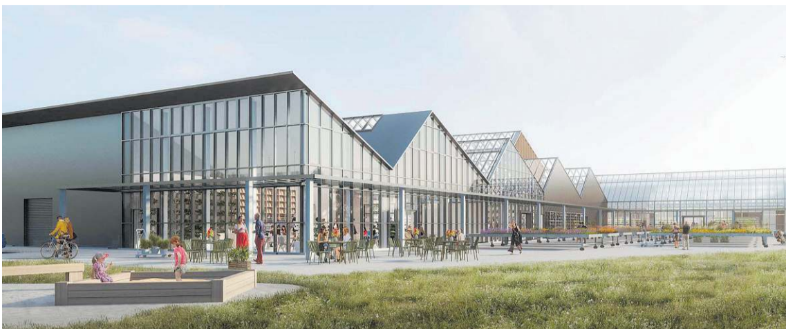
Ný verslun Garðheima við Álfabakka 6.

Aðkoma að nýrri verslun Garðheima við Álfabakka hefur verið til umræðu og vafist fyrir ýmsum. Meðal annars var rætt um að leggja niður afreina sem liggur frá Reykjanesbraut að Álfabakka. Hætt var við þau áform eftir að samgöngudeild Reykjavíkurborgar þótti það óráðlegt.