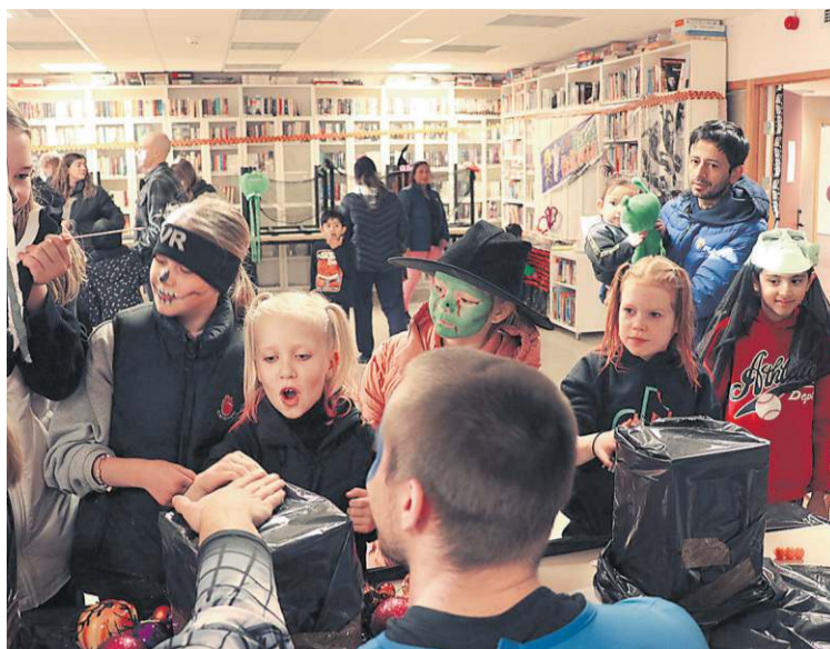
Þessi mynd var tekin á Hrekkjavöku Miðbergs.

Hægt var að fá andlitsmálingu, elda sykarpúða eða eplabita á báli og prufa að stinga hendinni í ógeðiskassa og þreifa þar fyrir sér á ýmsum óhugnaði. Síðast en ekki síst var það draugahúsið sem var einstaklega hræðilegt þetta árið og þurftu gestirnir aldeilis að taka á honum stóra sínum til þess að komast þar í gegn. Gestirnir gátu einnig gætt sér á vöfflum á Nornakaffihúsinu. Viðburðurinn var í félagsmiðstöðinni 111 og Gerðubergi. Það mætti töluverður fjöldi gesta og margir lögðu mikinn metnað í búningana.