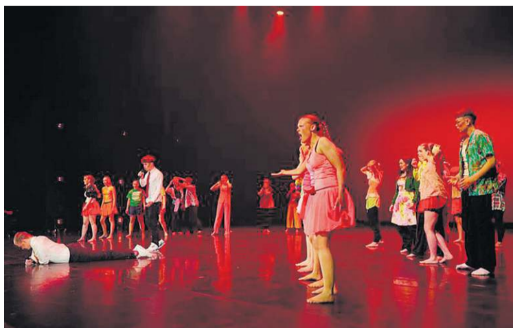
Úr atriði Seljaskóla í Skrekk.

Um 700 unglingar frá 24 skólum í Reykjavík tóku þátt í Skrekk sem haldinn var í 33. sinn. Í Skrekk fá unglingar í grunnskólum Reykjavíkur að vinna með hugmyndir sínar og þróa sviðsverk fyrir stóra